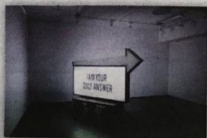
Utställningen består av flera olika uttryck.

Nordlander ville ha tillstånd att spela upp ett ljudverk utanför byggnaden. Norran uppmärksammade ansökan, och debatten kring ljudverkets likhet med böneutrop var igång.